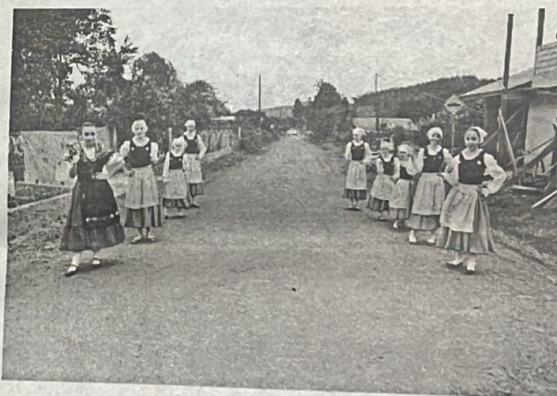
Recepção dos convidados na chegada para a festa

À tarde o público assistiu apresentações de danças típicas e dançou ao som do cantor Nando show.