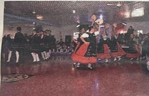
As tradicionais danças italianas foram lembradas pelo Grupo Folklorístico San Gaitano.

Com grande expectativa é aguardada a construção de um novo pavilhão comunitário, com espaço mais amplo e aconchegante. Perego conta que as tratativas com os órgãos públicos estão adiantadas, no entanto, dependem da regularização da documentação do terreno.