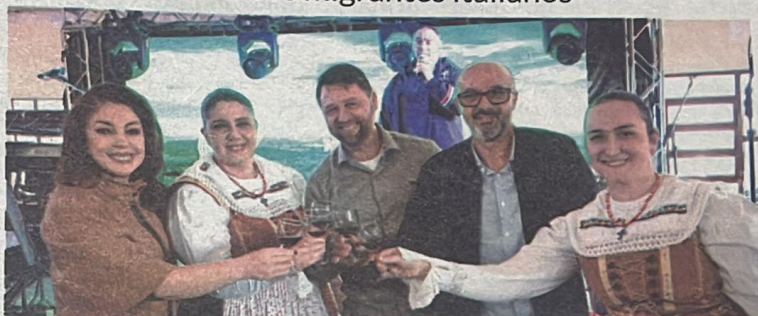
Festa Italiana reuniu comunidade em São Caetano com cardápio típico, vinho da pipa e apresentações culturais

A festividade iniciou com celebração religiosa na capela local, às 10h, reunindo moradores e visitantes. Em seguida, a sangria da pipa de vinho marcou a abertura oficial, às 11h30,