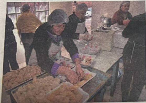
Com excelente padrão de qualidade, o almoço foi servido para mais de 550 visitantes.