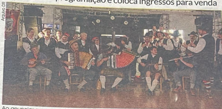
Ao anunciar a programação da XVI Festa Italiana, comissão organizadora dá início a venda dos ingressos.

“Quem quiser aproveitar, tem que adquirir logo. Não sabemos ao certo quantos