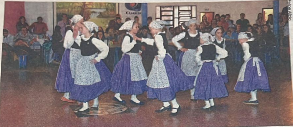
Com danças típicas, integrantes da comunidade demonstraram a cultura trazida pelos imigrantes e transmitida de geração para geração.