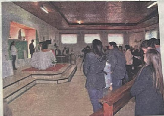
Tradicional missa dominical foi celebrada no dialeto italiano.