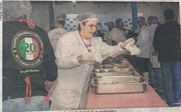
Um dos maiores atrativos da festa italiana é a colônia.

Mesmo com a mudança, houve falta de ingressos. Inicialmente, foram postas 550 unidades à venda. Dada a procura, foi ampliado em mais 50 unidades.