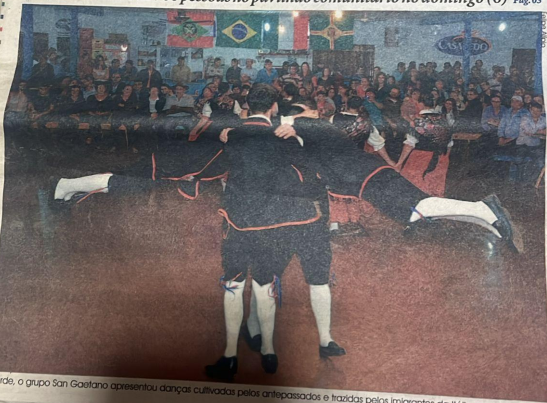
À tarde, o grupo San Gaetano apresentou danças cultivadas pelos antepassados e trazidas pelos imigrantes da Itália.

Festada comunidade São Caetano celebra uma década de homenagem aos colonizadores Italianos que povoaram São Lourenço do Oeste e arredores. O almoço com pratos típicos e vinho colonial, acompanhado por apresentações culturais, reuniu mais de 700 pessoas no pavilhão comunitário no domingo (6) Pág. 03