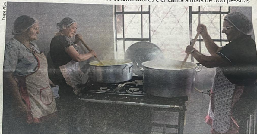
A preparação do almoço é feita por integrantes da comunidade.

Uma das características dos primeiros moradores da comunidade era a religiosidade. Prova disso é que os domingos saíam com a celebração da missa dominical. Por isso, a abertura da programação festiva é com a celebração de uma missa. Da mesma